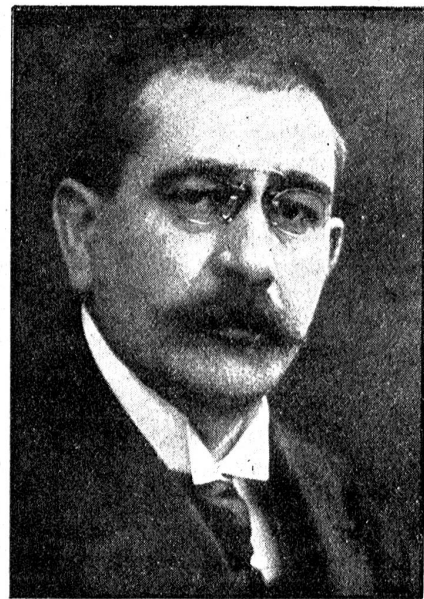
Der deutsche Reichswehrminister Noske (Mehrheitssozialist).

Die Pariserkonferenz scheint nichts zu merken. Clemenceau, der sich von den Folgen des mißglückten Attentats eines gut französischen Bolschewisten Cottin erholt, berät mit Foch das letzte Waffen-