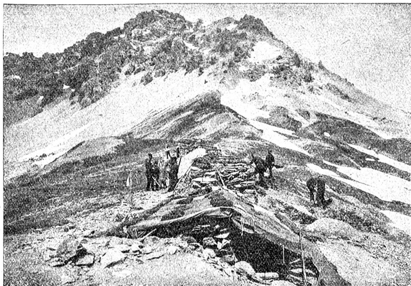
Gebirgsunterstände von schweizerischen Truppen an der österreichisch-italienischen Grenze.

Dem unsere Soldaten ihre Barackenlager am Ofenberg verlassen konnten. Kilometerweit begegnet man keinem menschlichen Wesen und kann so interessante Blicke werfen in die ungestört sich entwickelnde Tierwelt, steigen doch bisweilen die Hirsche und Gemsen bis auf die Wiesen des Fuornhotels hinab.