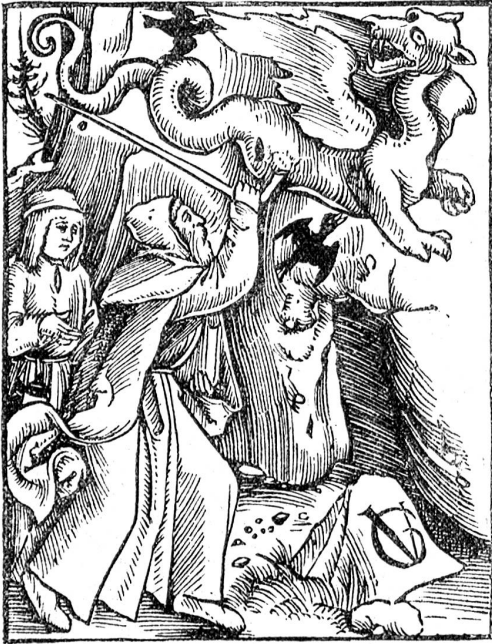
Beatus vertreibt den Drachen.

Er kleidete sich mühsam an und nahm den besten Rock, den er besaß, um sich nicht schämen zu müssen, wenn er über die Straße ging. Schuhe fand er keine. Und niemand war