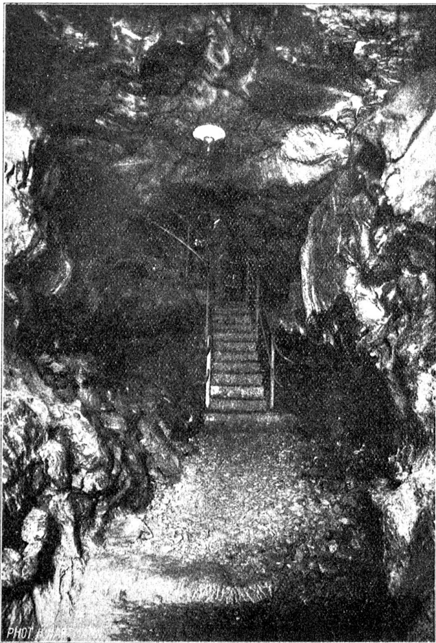
Im Innern der Höhle: Aufstieg zum Dom.