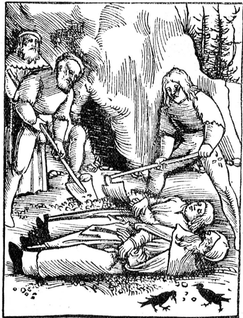
Justus wird dem Beatus beigelegt.

Die Namen Beatenberg, Beatenbucht und Beatenhöhle erinnern an den heiligen Glaubensboten Beatus, der in grauer Vorzeit am schönen Thunersee unsere heidnischen Vorfahren christianisiert haben soll. Fast möchte es scheinen, diese Namen seien genügend Beweis der wirklichen Existenz eines schweizerischen Beatus. Unsere Zeit ist aber kritischer und möchte jeder Sache auf den Grund gehen. Und wenn man nun die recht zahlreiche Beatusliteratur näher studiert, da wird der Glaube an einen Beatus gar bald wankend. Zwar fehlt es nicht an feurigen Verehrern der Geschichtlichkeit unseres schweizerischen Beatus, aber nach den neueren Forschungen überwiegen die Zweifel an der Existenz dieses Glaubensboten. Beschäftigen wir uns zuerst kurz mit der Volksüberlieferung, der selbstverständlich ein vollgültiger historischer Beweis nicht zukommt. Wir halten uns hiebei im wesentlichen an die Abhandlungen von G. Dumermuth, seinerzeit Pfarrer in Beatenberg, „Der Schweizerapostel Beatus“, der seinerseits aus einem alten Manuskript von Pfarrer Howald und aus Lütolf („Glaubensboten der Schweiz vor St. Gallus“) schöpfte, ferner an Pfarrer Buchmüller: „St. Beatenberg, Geschichte einer Berggemeinde“. Die Schrift von Dumermuth, die überaus lesenswert ist und die ganze Beatusfrage eingehend, allerdings etwas einseitig, beleuchtet, erschien 1889 und sei Lesern, die sich mit der Angelegenheit näher beschäftigen möchten, zum Studium bestens empfohlen.