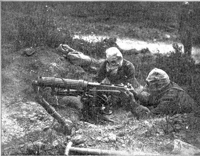
Geschützmannschaft mit der Gasmasken.

er denkt, dem Kerl kann ich nichts vormachen. Sag: Lieber, zu ihm. Lieber darf sonst niemand zu ihm sagen. Er sagt's nämlich den andern. Zude die Achseln. Schweige. Laß ihn sich den Mund abschleifen. Greife nie zu nach einem Angebot. Laß ihn darum betteln. Nimm immer, denn du bist es, der gibt. Vergiß das nie. Verstehst du mich, du Milchbart." Martin nickte schwach zum Zeichen der Zustimmung.