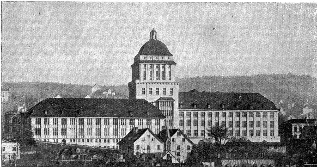
Die neue Universität in Zürich, von der Uraniabrücke aus gesehen.

An dem Werk rühmt man allgemein die weise Verbindung der praktischen und künstlerischen Grundsätze. Man hat in häuslicher Weise die verfügbaren Mittel zuerst zur Erstellung der Nutzräume in ihrer idealsten und praktischsten Form verwendet und erst nachher die künstlerische Ausgestaltung ins Auge gefaßt. Auf ca. 6000 Quadratmeter Bodenfläche hat man einen Gebäudekomplex mit einem Flächeninhalt aller Stockwerke von zusammen 28,100 Quadratmeter errichtet: die Nutzräume umfassen beim Kollegiengebäude 6230 Quadratmeter, beim Biologischen Institut rund 5920 Quadratmeter; für Gänge, Treppen, Vorplätze wurden 9850 Quadratmeter berechnet. Die beiden Gebäudekomplexe, die durch den zentralen Turm verbunden sind, enthalten in vier und fünf Stockwerken die Hörsäle,