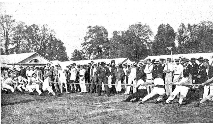
Vom 3. Athletiksportfest auf dem Sportplatz der Landesausstellung: Seilziehen (Zürich und Benningen).