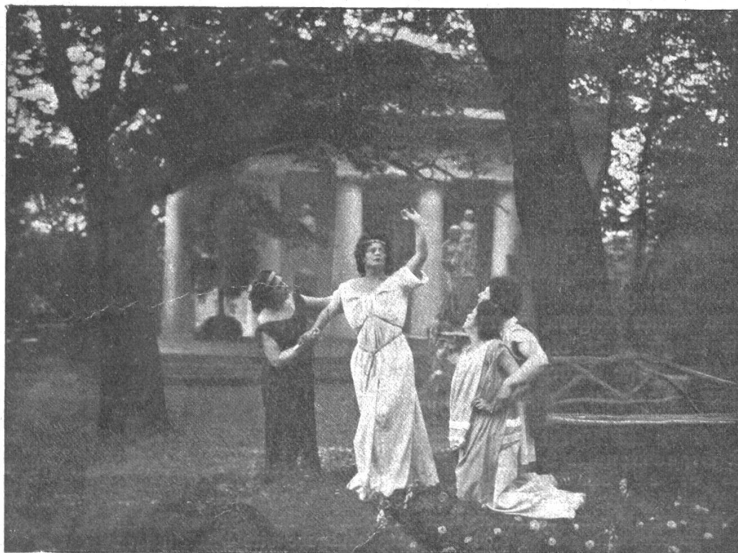
Freilichttheater in Bertenstein. Szene aus „Sappho“. (Text hiezu auf Seite 238.)

Rosegger hatte von Anfang an eine phänomenale Leichtigkeit im Produzieren. Die Stoffe flossen ihm aus seinen Kindheits- und Jugenderinnerungen wie aus einem lauterklaren, nie versiegenden „Bergquell“ zu. Die lange Reihe seiner Romane, in der jeder von der Waldheimat ausgeht oder hineinführt, begann dann mit den „Schriften des Waldschulmeisters“. Diese entstanden in den zwei glücklichsten