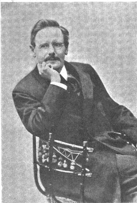
Peter Rosegger. (Nach einer früheren Aufnahme.)

Die Mutter war es, die mit dem etwas schwächlichen und schwächlichen aber aufgeweckten Jungen zum Pfarrer