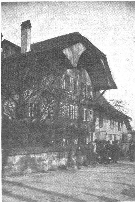
Das alte Bauer-Gut „beir Linde“ in Bern.

Das Türmlihorn, wo sich das Unglück zugetragen, ragt aus dem Nordwestgrat des Gfür 2491 Meter hoch empor. Es umschließt mit dem Hauptgipfel das enge Rüggenthal. Gfür und Türmlihorn gehören zu den bedeutendsten Erhebungen der Kette, die sich vom Albristhorn zum Riesen hinzieht und das Engfligen- und Kandertal vom Sinnmental trennt. E. Schr.