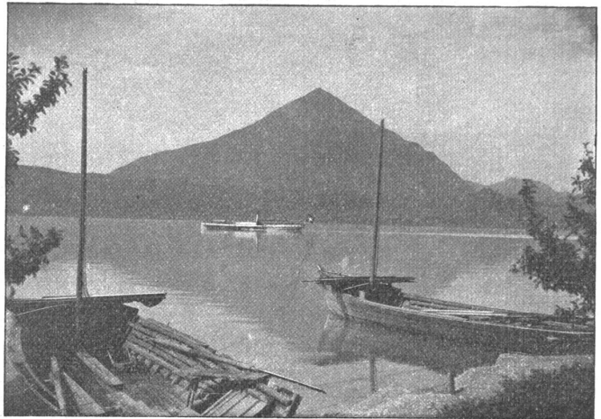
Am Chunersee, im Hintergrund der Riesen.

Kaum hatte am Abend die Glocke Feierstunde verkündet, machte sich Franz auf den Weg; wie Buschräuber schlüch Heinrich und Josef hinter ihrem Dpfer her und hätten doch nicht der geringsten Vorsicht bedurft; denn unbekümmert schritt Franz seines Weges, dem südlichen Außenquartier zu.