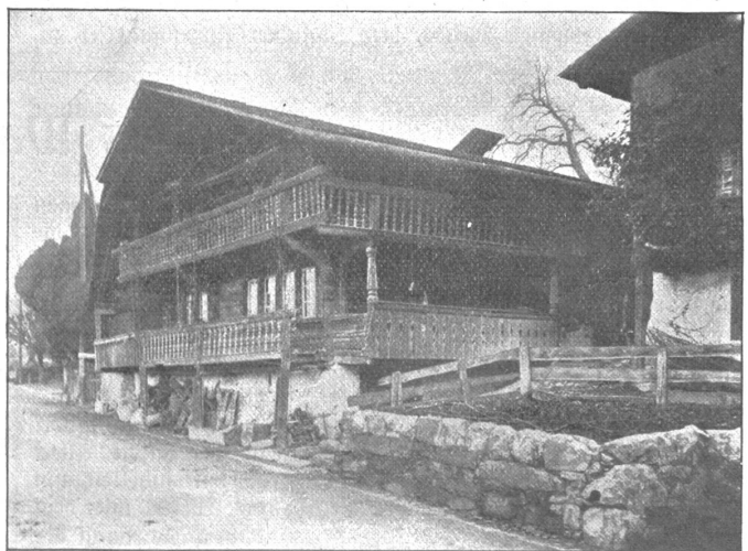
Bauernhaus in Merligen.

Es ist klar, wenn etwas Eingeschlummertes, oder vielleicht gar als überwunden Geglaubtes wieder geweckt werden soll, so muß es zielbewußt geschehen. Auch die Wandergefnung