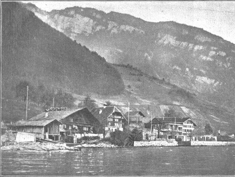
Merligen, Dorf mit Beatenberg.

im Herzen des Gesellen eine Jahrhunderte alte Sitte wachküßte und ihn mit dem Heimweh nach der Ferne erfüllte. — Wie viel Kraft, Humor und frischgeschöpfte Lebenskenntnis, wie viel Sinnklarheit und Gemütsbereicherung gewann nicht die Jugend und das ganze Volk aus dieser sozial und wirtschaftlich fest begründeten Einrichtung. Schon ein Blick in unsere Volkspoesie lehrt uns davon. In ihr kehrt die Gestalt des Wanderburschen und sein Wesen immer wieder. In ihr finden wir den freien, willkommenen, scheidenden Gesellen und den übermütig frohen, abenteuerlustigen, losen oder den treu überbenden und sich mühenden Burschen.