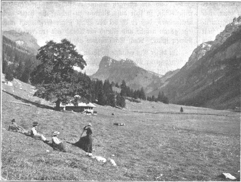
Partie aus dem Justistal.

möchte geradezu sagen, wohlbedachten Gliederung, wie sonst kein Gebirge der Erde und gerade darauf beruht ihre besondere Schönheit, die sie auch allen andern Bergländern überlegen macht. . . Wohl gibt es höhere Gebirge als sie; Himalaja und Transhimalaja strecken ihre Schneedome fast doppelt so hoch ins Blaue, die tausend Kilometer ihrer Längserstreckung schrumpfen fast zu einer Hügelkette zusammen, wenn man das „Dach der Welt“, das Hochland von Zentralasien oder die Ketten der Nordalpen damit vergleicht. Aber nicht das Massenhafte und Gigantische erringt den Preis im Reich des Schönen! In jedem andern Gebirge sind die Landschaftsbilder gleichförmiger; ihre wuchtige Last ermüdet den Beschauer, ungeheure Steppen oder selbst Wüsten machen sie unwirksam und öde, die Riesengebirge türmen sich in unübersichtlichen Ketten, sie sind schwer und klosig, und es mangelt ihnen der Adel der Form. Wie ganz anders in den Alpen! Auf engstem Raume beisammen berühren sich die Kontraste. Doch nicht zum Bizarren und Abenteuerlichen verflochten sich der Gesamteindruck, sondern stets strebt er nach Harmonie. Es gibt kein großes Tal in den Alpen, in dem das Landschaftsbild nicht von dem Eindruck der Leppigkeit bestimmt wird, in dem sich nicht die ganze Skala der Empfindungen vom heiter Lieblichen bis zum großartig Ernsten in dem Beschauer aufrollen könnte.