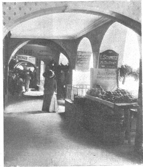
Spitalgasslaube am Vormittag.

gaul gelehnt, das halbe Leben schlafmüde vernicken. Ihre Augen hat Gleichmut, Gleichgültigkeit und weiß der Himmel