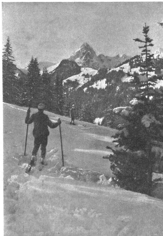
Winter bei Gstaad. — Blick vom Hornberg.

noch die Wirtschaften Licht hatten. Er suchte daran zu denken, daß ja noch gar nichts Schlimmes geschehen war. Aber