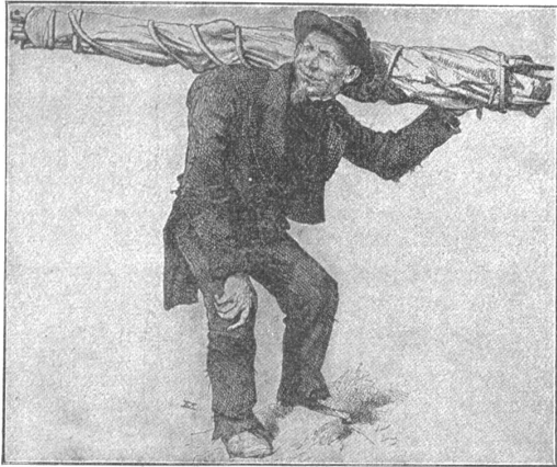
Mognet, der bucklige Träger Whymper's. (Sranccé.) Nach E. Whymper, Berg- und Gletscherfahrten.

vom Furggengletscher als unzugänglich darstellten, so harmlos waren, daß man auf ihnen herumlaufen konnte. Das