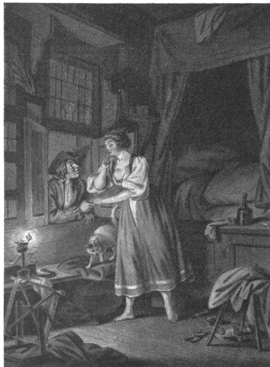
Sigm. Freudenberger Kiltgang Aus dem Künstlerbuch

Und nun zum Schlusse legen wir unsern Lesern zwei Dinge noch einmal dringend ans Herz: besucht das Kunst-