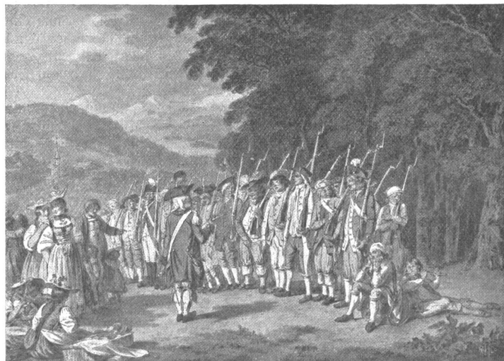
S. R. König Crülmusterung 1797 Aus dem Künstlerbuch

um den Schreibtisch die Hand drücken kann: „Behüt euch Gott zusammen. Ich geh' in die Ferien.“