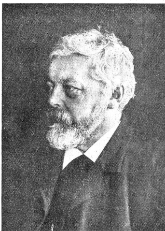
Bundespräsident L. Forrer von Winterthur.

Am 1. Januar hat Bundesrat Forrer zum zweitenmal seit seinem Eintritt in unsere oberste Exekutive im Jahre 1902 die höchste Ehrenstelle, die unser Land zu vergeben hat, angetreten. Er begann seine Tätigkeit als Bundespräsident mit dem üblichen Neujahrsempfang der bernischen Behörden und der in Bern akkreditierten fremden Diplomaten. Die glänzenden Uniformen der Botschafter und Gesandten haben auch dieses Jahr wieder eine große Zuschauermenge angezogen.