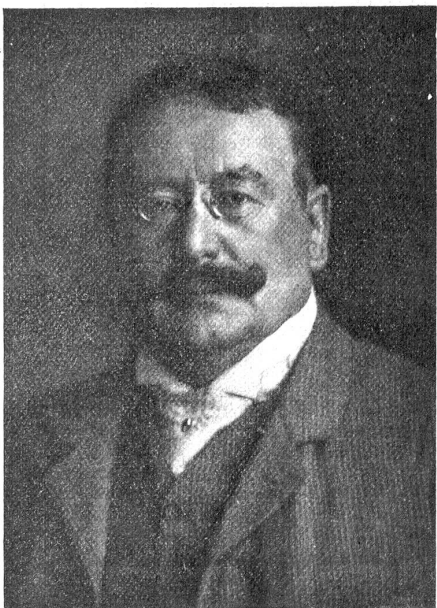
† Julius Maggi.