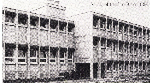
Schlachthof in Bern, CH