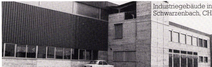
Industriegebäude in Schwarzenbach, CH