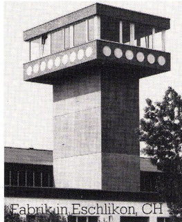
Fabrik in Eschlikon, CH