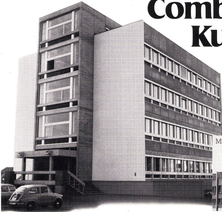
Milchhof in Emmen, CH