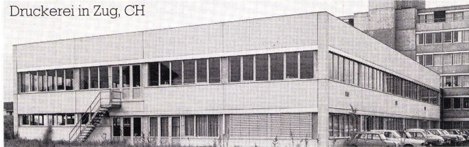
Druckerei in Zug, CH