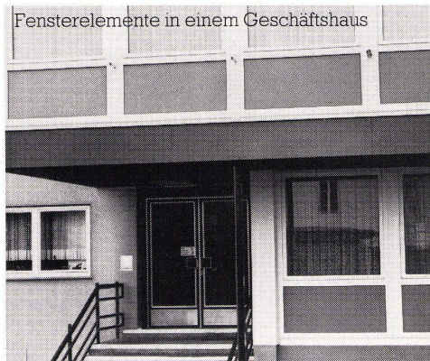
Fensterelemente in einem Geschäftshaus

Konstruktionsdetails, EMPA-Prüfberichte, technische Daten sowie Anschriften von Fensterbaubetrieben erhalten Sie durch: