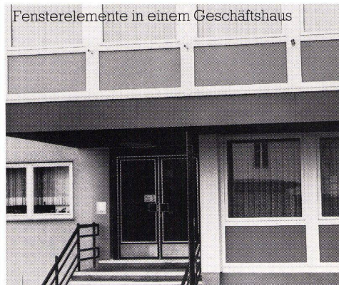
Fensterelemente in einem Geschäftshaus

Konstruktionsdetails, EMPA- Prüfberichte, technische Daten sowie Anschriften von Fensterbaubetrieben erhalten Sie durch: