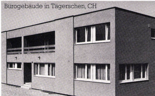
Bürogebäude in Tägerschen, CH