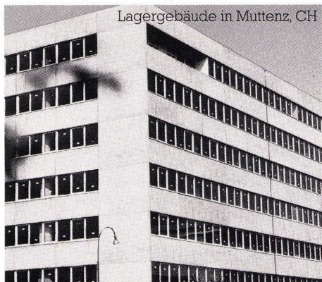
Lagergebäude in Muttenz, CH