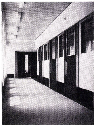
Korridor im Wohn- und Arbeitsheim für Gelähmte in Reinach BL. Wände bekleidet mit Texto-Glass 6297.

Der größte französische Hersteller von Glasgeweben, Stevens-Genin, Villeurbanne, hat die attraktive Innenwandverkleidung Texto-Glass Typ 6297 aus Glasfaser-gewebe auf den Markt gebracht. Texto-Glass besitzt eine Reihe hervorragender Eigenschaften. Es ist waschbar, stoß- und kratzfest sowie unbrennbar. Dank ihrer natürlichen Gewebestruktur sieht diese Wandbekleidung außerdem gediegen und elegant aus. Sie besteht zu 100% aus Glasfasern und kann auf Beton, mörtelverputzte Oberflächen, Holzfasertafeln, Gipsplatten usw. aufgeleimt werden. Mit einem feuerfesten Anstrich auf Latex- oder Ölbasis kann dieser «Glasfaser-tapete» jede gewünschte Farbe gegeben werden. Texto-Glass ist dimensionsstabil, was seine Anwendung beträchtlich erleichtert. Zwischenwänden leichter Konstruktion (zum Beispiel aus Gipsplatten) gibt die Bekleidung mit Texto-Glass eine wesentlich erhöhte Oberflächenfestigkeit. Aus diesem Grunde kann das Produkt vor allem auch bei der Renovation von alten, rissigen Innenwänden kostengünstig eingesetzt werden. Neben ihrer hohen Stoß- und Kratzfestigkeit ist wohl der Hauptvorteil der mit einem feuerfesten Anstrich aufgetragenen Texto-Glass-Wandbekleidung ihre hervorragende Feuerresistenz, die die strengsten Vorschriften hinsichtlich Nichtentflammbarkeit erfüllt.