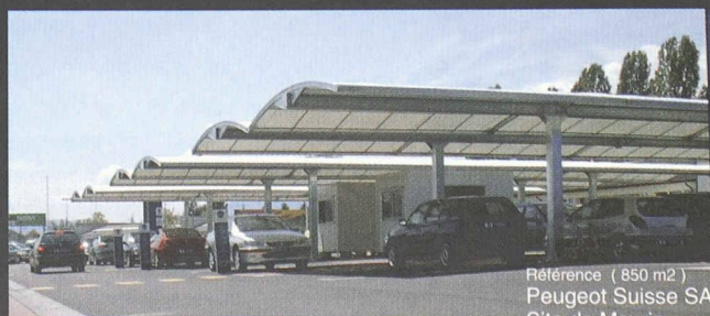
Référence ( 850 m2 ) Peugeot Suisse SA Site de Meyrin