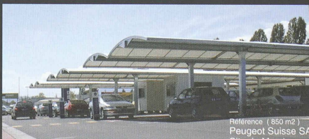
Référence ( 850 m 2 ) Peugeot Suisse SA Site de Meyrin