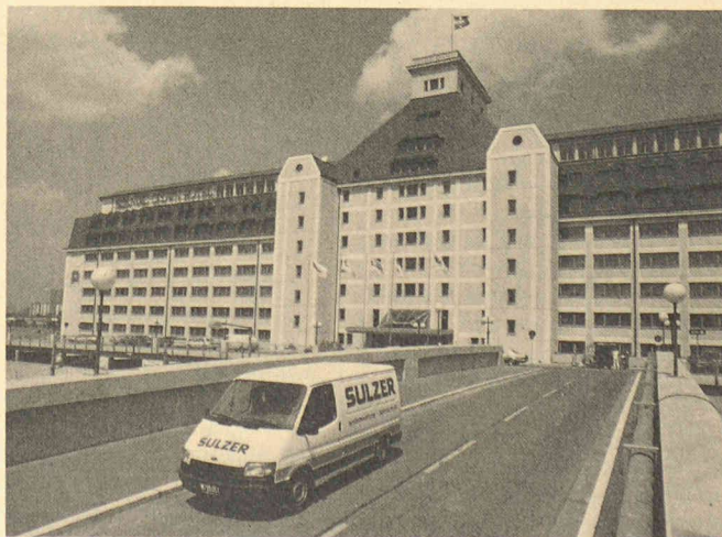
Hôtel Scandic Crown de Vienne, huit étages et 150 m de long, vu de la route d'accès surplombant la rue Handelskai au bord du Danube.

Les salles de conférences disposent de systèmes de régulation très perfectionnés qui permettent d'adapter les conditions climatiques aux besoins individuels. La plage de réglage va de l'arrêt complet du système, en passant par toutes les charges intermédiaires, jusqu'à l'enclenchement d'une ventilation surpuissante permettant d'éliminer s'il y a lieu les grandes quantités de fumée.