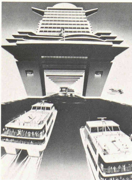
Esquisse des plans du Phœnix World City , un superpaquebot de demain, véritable ville flottante sur les mers.

La Suisse est au cœur des réseaux routier et ferré européens. Ce qui se passe autour d'elle ne saurait nous laisser indifférents : nous ne pouvons ni céder aux pressions des grandes nations européennes, ni nous enfermer dans une citadelle. Comment concilier l'intérêt national et l'intérêt de l'Europe ? Pour faire le point sur cette question, le Groupe romand des ingénieurs de l'industrie de la SIA (GIIR) organise le samedi 16 septembre 1989, à Lausanne, une journée d'étude sur les transports. Une série de personnalités de premier plan y présenteront des exposés complétés par deux tables rondes, consacrées au rôle de la Suisse dans le futur réseau ferré européen à grande vitesse et dans le trafic des marchandises.