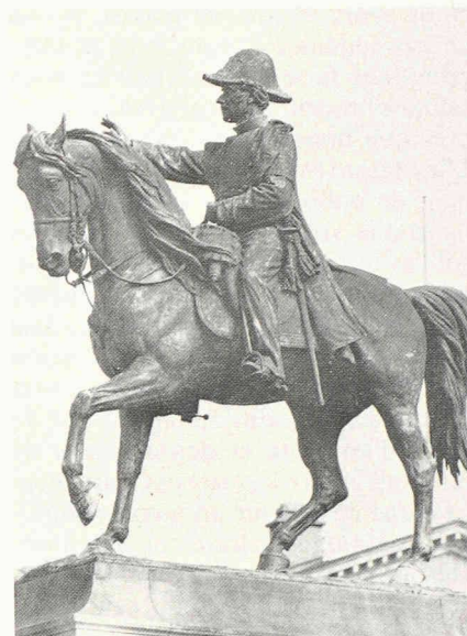
1851: première assemblée générale à Genève de la SIA; un Genevois, G.-H. Dufour, est nommé membre d'honneur. Vingt ans plus tard, il sera nommé président d'honneur de la SIA, distinction unique à ce jour.

Mais nous nous devons de garder ce capital, cette richesse que représente