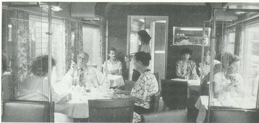
Une ambiance de classe pour une offre entièrement renouvelée.

La solution choisie pour répondre à cette demande diversifiée s'inspire de celle adoptée depuis longtemps en aviation : la préparation centralisée dans une base fixe, située en l'occurrence à Genève. La méthode mise au point par le grand cuisinier français Georges Pralus recourt partiellement à la cuisson dite « sous vide » : les mets, préparés à base d'aliments parfaitement frais, sont cuits dans des sacs en plastique vidés de leur air puis immédiatement refroidis et intégrés à une chaîne de froid continue conduisant jusqu'aux voitures-restaurants, où ils sont « régénérés » dans un appareil mixte à vapeur. La fraîcheur des produits de base, l'hygiène dans la préparation, effectuée dans des locaux incomparablement mieux adaptés qu'une cuisine roulante, le maintien sous vide et à basse température jusqu'au réchauffement à la demande : autant de facteurs promettant une nouvelle qualité de restauration. Les dégustations comparatives ont classé