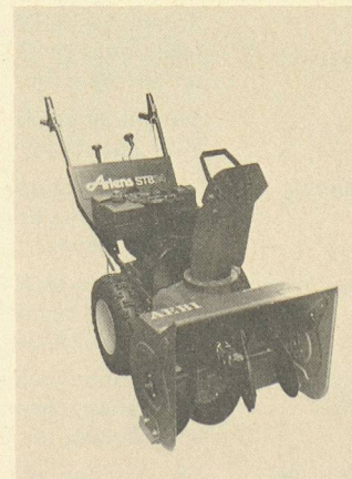
Trois modèles de turbofraises Aebi et quatre modèles Ariens: pour le blanc.