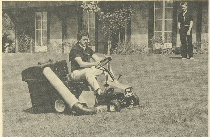
Le tondotracteur Ariens: le moyen le plus confortable de se mettre utilement au vert!

Aebi & Co SA Fabrique de machines 3400 Berthoud Tél. 034/21 61 21