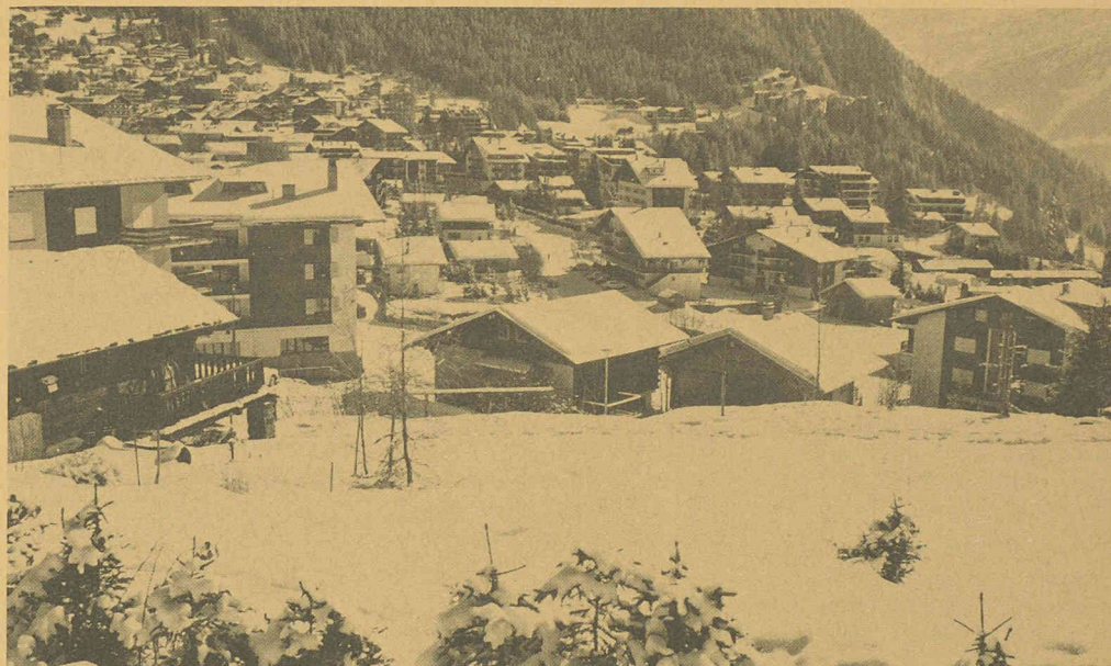
Rêves de neige poudreuse: l'aimant qui attire 25 000 visiteurs à Verbier.

Les premières ampoules brillent dans la vallée en 1903, mais également à Verbier lors de la mise en service de l'usine du Tombai. En 1933, pour répondre aux demandes des particuliers, le courant basse tension est amené dans des mayens du village. Cette installation se termine par un fameux bal, le 24 décembre. Ce n'est pourtant qu'à l'approche des années