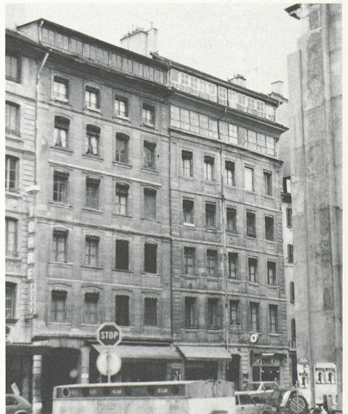
Fig. 2. — Ateliers de cabinetiers à Saint-Gervais (rue Rousseau).