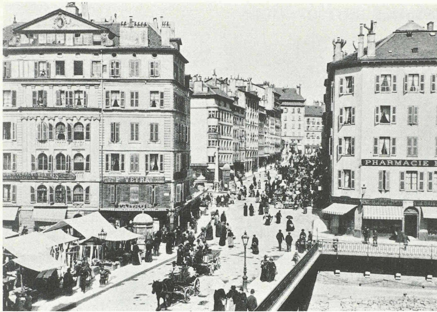
Fig. 3. — Ponts de l'île et place de Saint-Gervais à la fin du XIX e siècle. On remarque les différents registres architecturaux de la maison Soret (à gauche), probablement surélevée.