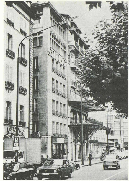
Fig. 4. — Immeuble ancien surélevé vers 1940 par l'architecte Saugey; situé au quai Général-Guisan, ce bâtiment a été démoli il y a quelques années.

interventions permettront-elles de poursuivre la transformation de cette cité dans le respect de sa tradition historique?