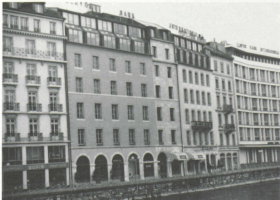
Fig. 6. — Surélévation du bâtiment de la Lloyds au quai Besançon-Hugues.