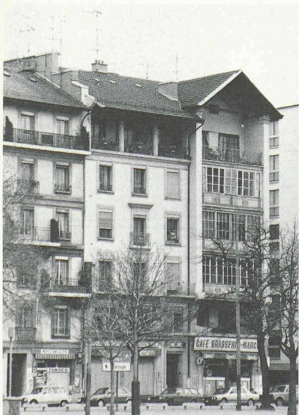
Fig. 5. — Bâtiments construits au début du XX e siècle (avenue Henri-Dunant). On remarque l'expression du couronnement.

Sans vouloir examiner plus longuement quels sont les courants architecturaux qui ont préconisé des changements de registre en façades, il y a lieu de souligner que plusieurs projets de surélévation d'immeubles ont été entrepris à Milan il y a déjà plusieurs années par le groupe d'architectes BBPR. Tel est par exemple le cas d'un bâtiment situé à la rue Giuseppe Verdi, et qui a fait en 1966 l'objet d'une surélévation particulièrement