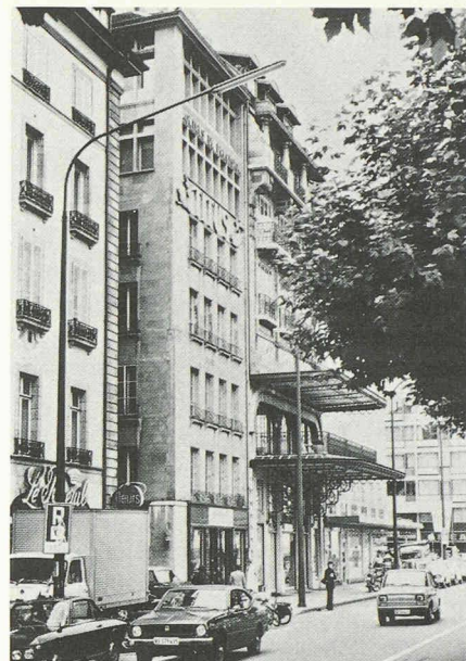
Fig. 4. — Immeuble ancien surélevé vers 1940 par l'architecte Saugey; situé au quai Général-Guisan, ce bâtiment a été démoli il y a quelques années.

interventions permettront-elles de poursuivre la transformation de cette cité dans le respect de sa tradition historique?