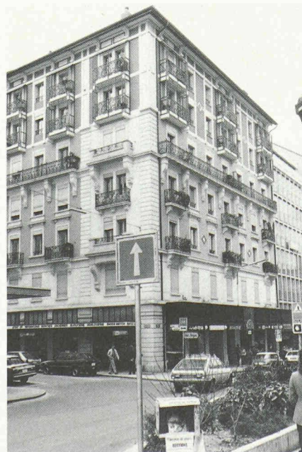
Fig. 8. — Rehaussement d'un immeuble à la rue du Cendrier.

Vers 1975, la transformation des immeubles de la «Lloyds Bank», au quai Besançon-Hugues, pose un problème de nature particulière. Faudra-t-il ou non démolir les bâtiments existants afin de pouvoir abriter le programme retenu? Celui-ci nécessite un volume conforme au gabarit légal. L'importance des trois immeubles concernés, expression d'un état parcellaire ancien, ainsi que leur situation particulièrement en vue sur les berges du Rhône conduiront au choix d'un parti de surélévation. Le rythme général des façades du quai sera ainsi respecté. L'architecte J. V. Bertoli choisira une expression où les vitrages dominent; ceci n'est pas