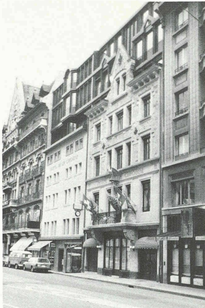
Fig. 7. — L'hôtel de la Cigogne à la place Longemalle.

démonstrative, la corniche et le départ de l'ancien toit étant conservés.