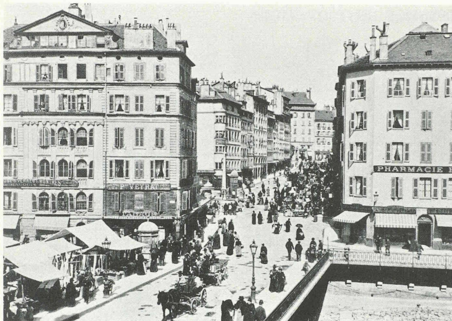
Fig. 3. — Ponts de l'île et place de Saint-Gervais à la fin du XIX e siècle. On remarque les différents registres architecturaux de la maison Soret (à gauche), probablement surélevée.