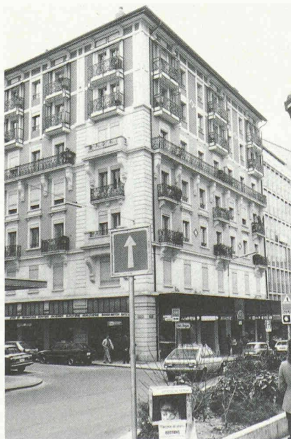
Fig. 8. — Rehaussement d'un immeuble à la rue du Cendrier.

Vers 1975, la transformation des immeubles de la «Lloyds Bank», au quai Besançon-Hugues, pose un problème de nature particulière. Faudra-t-il ou non démolir les bâtiments existants afin de pouvoir abriter le programme retenu? Celui-ci nécessite un volume conforme au gabarit légal. L'importance des trois immeubles concernés, expression d'un état parcellaire ancien, ainsi que leur situation particulièrement en vue sur les berges du Rhône conduiront au choix d'un parti de surélévation. Le rythme général des façades du quai sera ainsi respecté. L'architecte J. V. Bertoli choisira une expression où les vitrages dominent; ceci n'est pas