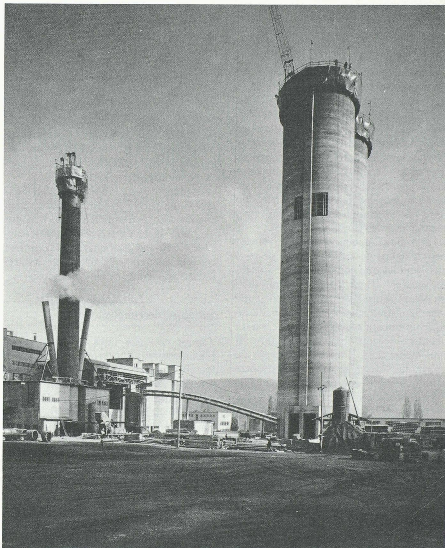
Des tours dans le ciel du Pays de Vaud: silos d'une capacité totale de 24 000 tonnes à l'usine d'Eclépens.

Bien sûr, il y eut des constructeurs de pyramides; mais s'il y avait en ce temps-là un fort désir de pérennité, une bravade des siècles, qui réussit pour celles-