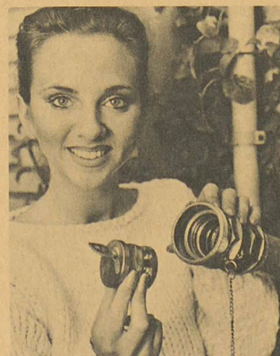
La fermeture pour citerne DOM TV-1.

... est une chose tout à fait possible maintenant grâce à un nouveau système de fermeture de sûreté pour citernes mis au point par les services techniques de la maison DOM. Ce système, applicable à la fois aux maisons uni- et plurifamiliales et aux