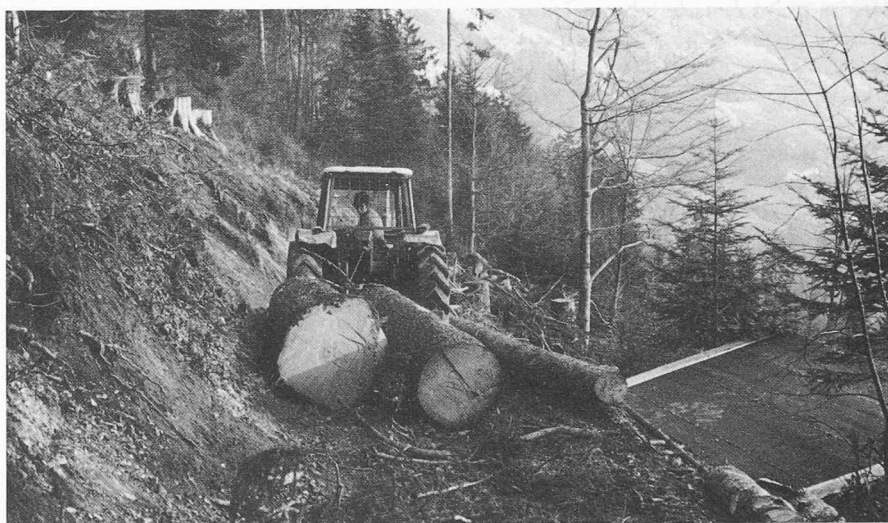
L'adaptation aux conditions actuelles de la technique et du marché est une exigence vitale tant pour l'économie du bois que pour l'économie forestière suisses.

En effet, seuls des entrepreneurs et des cadres qualifiés, familiarisés avec la technologie moderne et l'économie, peuvent relever avec succès le défi lancé par l'avenir. Du fait de ses qualités naturelles, le bois est une matière première beaucoup plus compliquée que ce qu'on a admis jusqu'à présent. C'est pourquoi