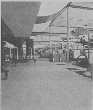
Assainissement d'un sol industriel, notamment avec colmatage des fissures, des trous et des failles.

Il en résulte des trous, des fissures ou d'autres dommages qui mettent en cause la sécurité et entravent les activités industrielles. L'assainissement des sols devient inévitable, quels que soient les coûts et le manque à gagner qu'il occasionne, du fait de l'interruption des activités productives dans les locaux concernés.