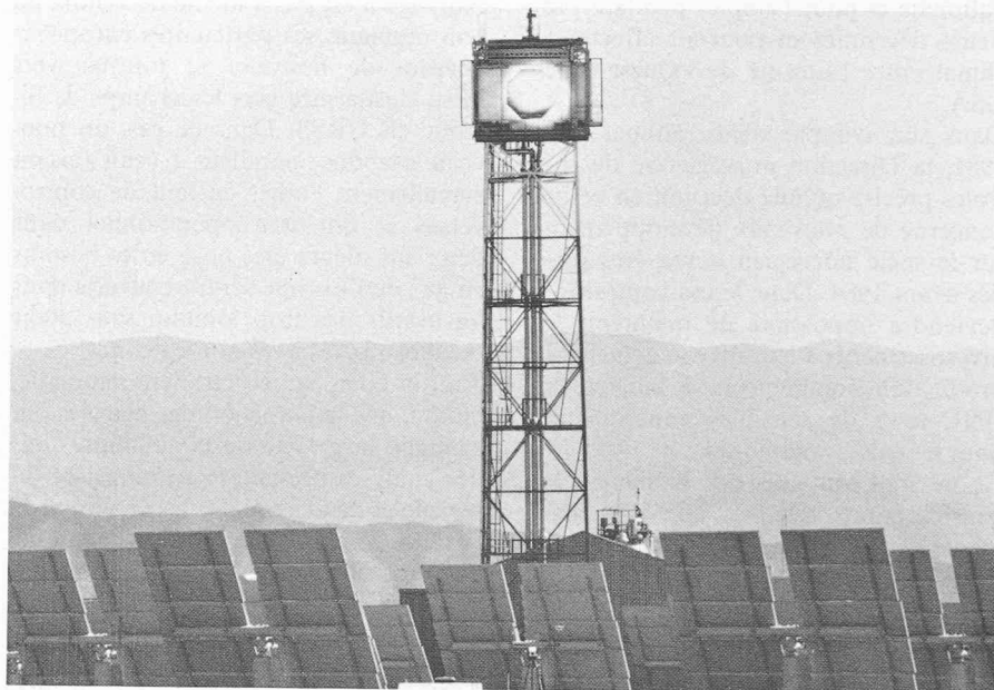
Fig. 1. — Héliostats et récepteur de la centrale solaire d'Almeria (Espagne).

Le pouvoir d'irradiation des rayons solaires a été mesuré sur le récepteur au