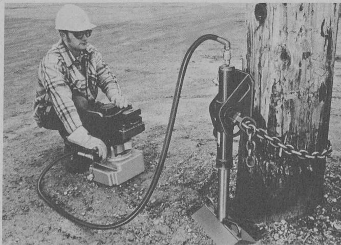
L'arrache-poteaux Thiermann au travail.