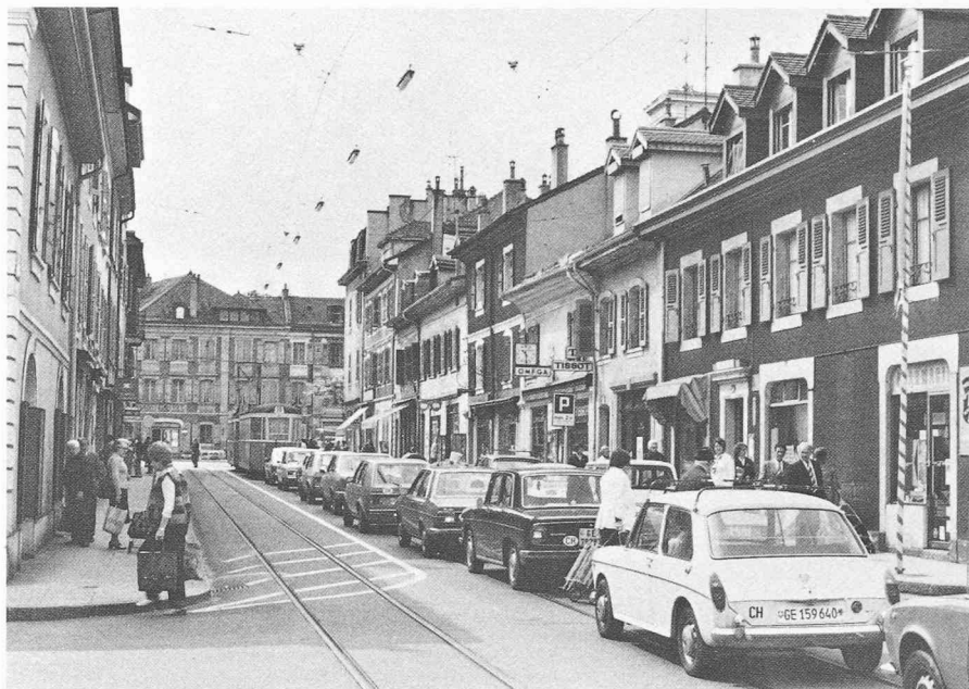
Carouge GE, ville d'importance nationale. Dans la mesure où il s'agit de l'une des rares villes importantes ne présentant pas de noyau médiéval, Carouge, dont la planification et la réalisation remontent au XVIII e siècle, justifie sans la moindre hésitation une classification nationale, du fait en particulier de la présence d'un système de voies et de places clairement défini et de la conservation de nombreux tronçons de rue encore intacts, avec les bâtiments qui les délimitent.