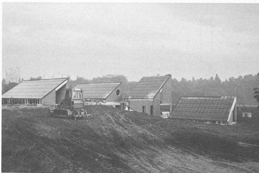
Fig. 1. — Vue d'ensemble de l'installation.

Consommation d'eau à 45^{\circ}\text{C} : par douche 80 litres à +40^{\circ}\text{C} soit 70 litres à +45^{\circ}\text{C} et 10 litres à +9^{\circ}\text{C}