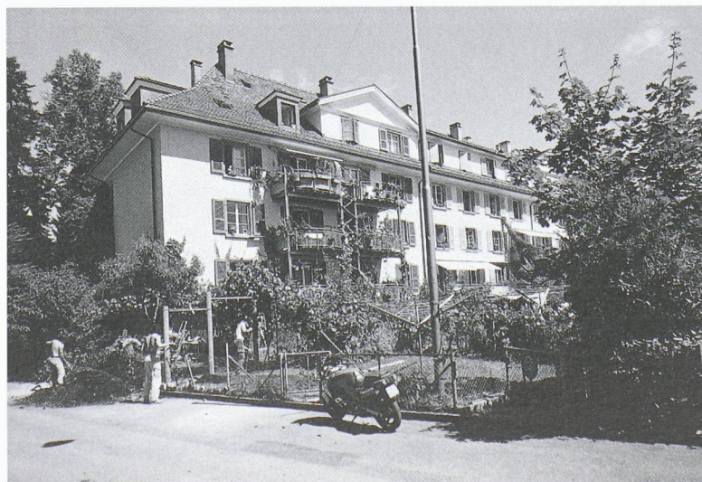
Ensemble d'habitation Oberes Murifeld

Les locaux de l'entreprise de matériaux de construction Josias Gasser à Coire, qui ont été distingués comme une mise en pratique exemplaire - conçue dans sa globalité, puis concrétisée à tous les niveaux - des postulats adoptés par l'entreprise en faveur du développement durable.