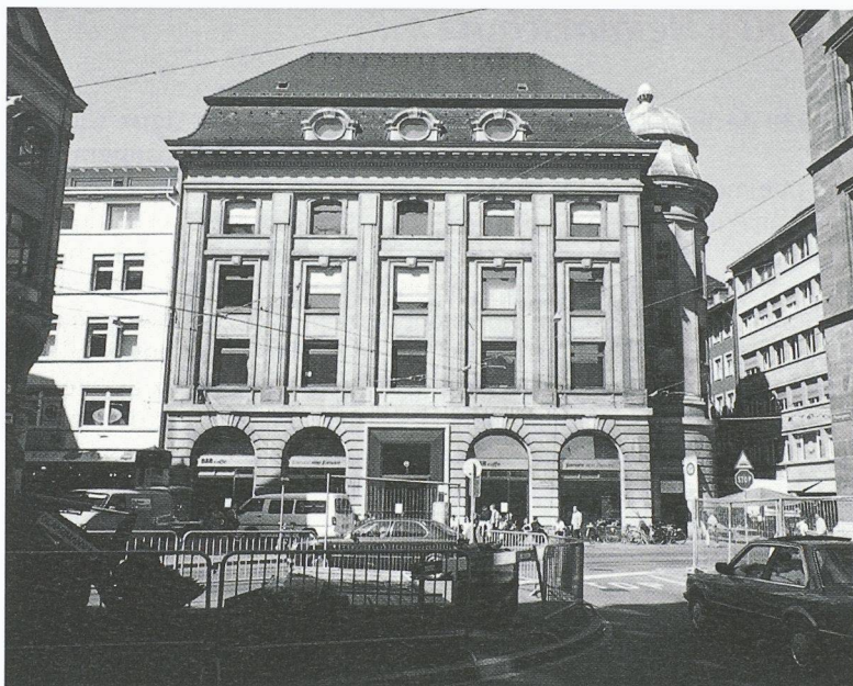
Ancien siège central de la Banque populaire à Bâle