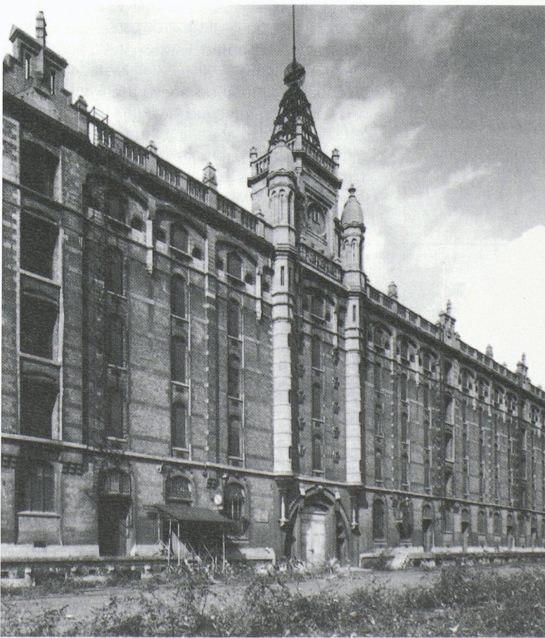
L'architecture a cautionné la nouvelle civilisation industrielle en affichant des images de marque concluantes. Ici: l'entrepôt de Tour et Taxis, Bruxelles, façade Est.

Quant à l'appellation « archéologie industrielle », si elle peut a priori paraître antinomique - archéologie renvoyant traditionnellement à la recherche et aux fouilles concernant une civilisation enfouie et disparue, alors qu' industrielle s'applique au