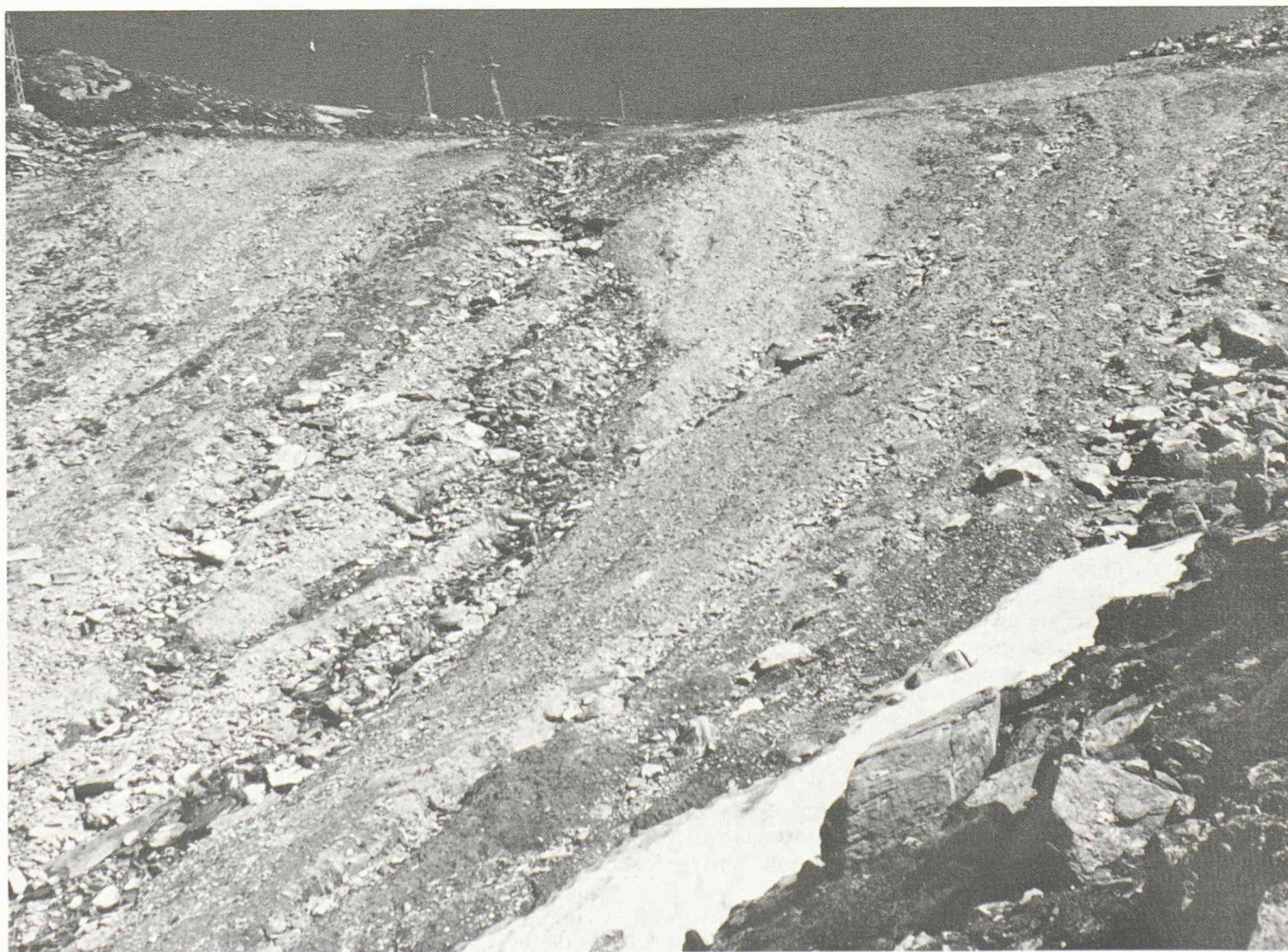
Grand aplanissement dans les Alpes valaisannes, entraînant une grave érosion. La piste large de plus de 100 m et longue de plusieurs centaines de mètres est légèrement en forme d'auge et se trouve dans la région d'un ruisseau. Un système d'érosion s'est formé ici, couvrant presque 1 ha, composé de neuf rigoles partiellement reliées, accusant des profondeurs de 30 à 100 cm. L'érosion est estimée à quelque 400 t/ha.

Les conditions climatiques influent donc sur la potentialité de reverdissement. Toutefois, le climat agit aussi avec d'autres facteurs écologiques locaux. La grande diversité de la végétation dans les altitudes moyennes ne s'explique que par les différences des conditions locales. Sur les pistes, la végétation varie souvent d'une faible surface à une autre. Dans beaucoup de sites skiabiles, les limites de végétation traversent de grandes pistes. En même temps, les variations du degré de couverture sur de petits espaces sont très fortes. Une étude approfondie de ces surfaces révèle que la réussite du reverdissement au-dessus de 1600 m dépend dans une large mesure de la nature du sol. La plupart des limites de la couverture végétale courent le long de celles, parfois très nettes, des diverses pistes artificielles. Dans quelques rares cas, le microclimat (couche de neige insuffisante ou absente par moments) et la sollicitation mécanique sur les pentes fortement convexes agissent probablement en tant que