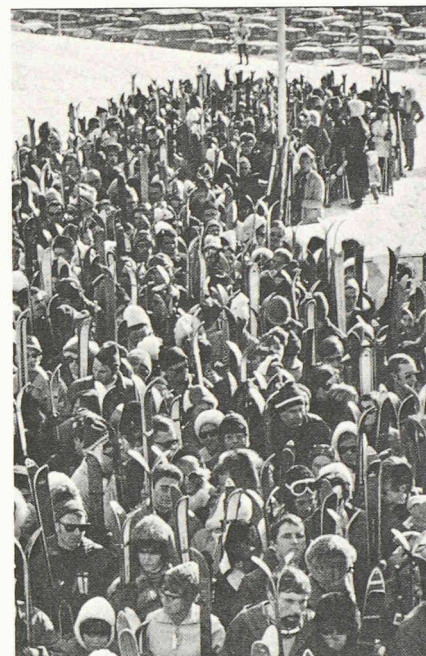
L'«avalanche» de skieurs exige une infrastructure toujours plus envahissante : téléskis, pistes, parkings. Va-t-on arrêter un jour cette emprise grandissante ?