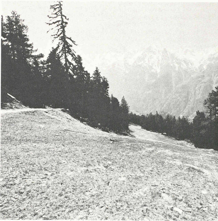
Descente de l'Hanigalp, à Grächen en Valais.