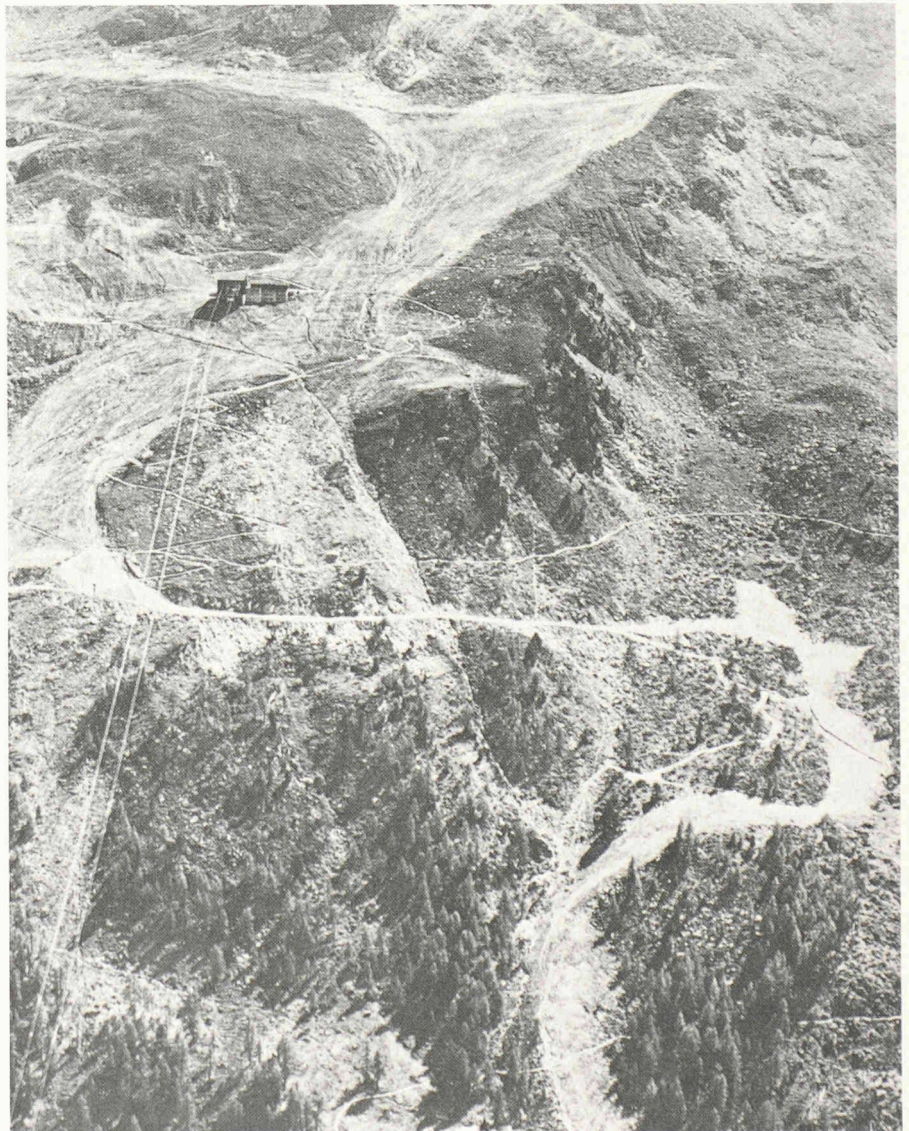
Paysage de ski de piste en été: zone d'ébouilissement ou région de promenades? (Furtschellas au-dessus de Sils, dans les Grisons.)