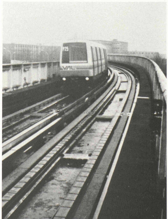
Remède coûteux : le VAL de Lille.