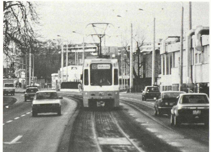
Circulation : du solide (par exemple sur le pont du Mont-Blanc)...

... ou du fluide (tram en site propre) ?