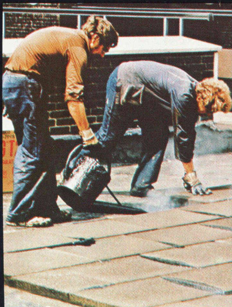
Toiture plate sur dalle en béton : Système «Toiture compacte», avec FOAMGLAS T2 collé à pleine adhérence et à joints remplis au bitume chaud.