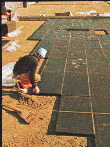
Isolation de sol sous radier/ dallage : Pose à sec sur couche d'égalisation de panneaux FOAMGLAS-BOARD, revêtus en usine et sur les deux faces de papier bitumé.