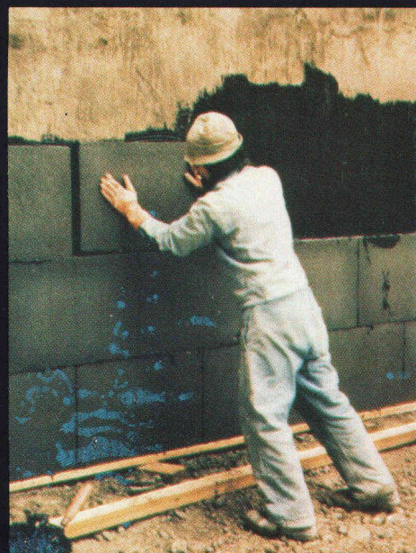
Mur contre terre : Isolation périmétrique avec FOAMGLAS-BOARD ou FOAMGLAS T2 collé à pleine adhérence et à joints remplis au moyen de colle bitumineuse à froid.