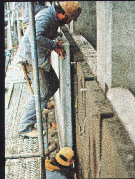
Façade ventilée avec revêtement en éléments lourds posés à joints ouverts : FOAMGLAS T2 collé à pleine adhérence et à joints remplis au moyen de colle bitumineuse à froid.

FOAMGLAS®, l'isolant thermique en verre cellulaire, le matériau aux propriétés physiques exceptionnelles telles que : conductibilité thermique invariable dans le temps, étanchéité totale à l'eau et à la vapeur d'eau, incombustibilité, imputrescibilité et résistance mécanique élevée sans tassement.