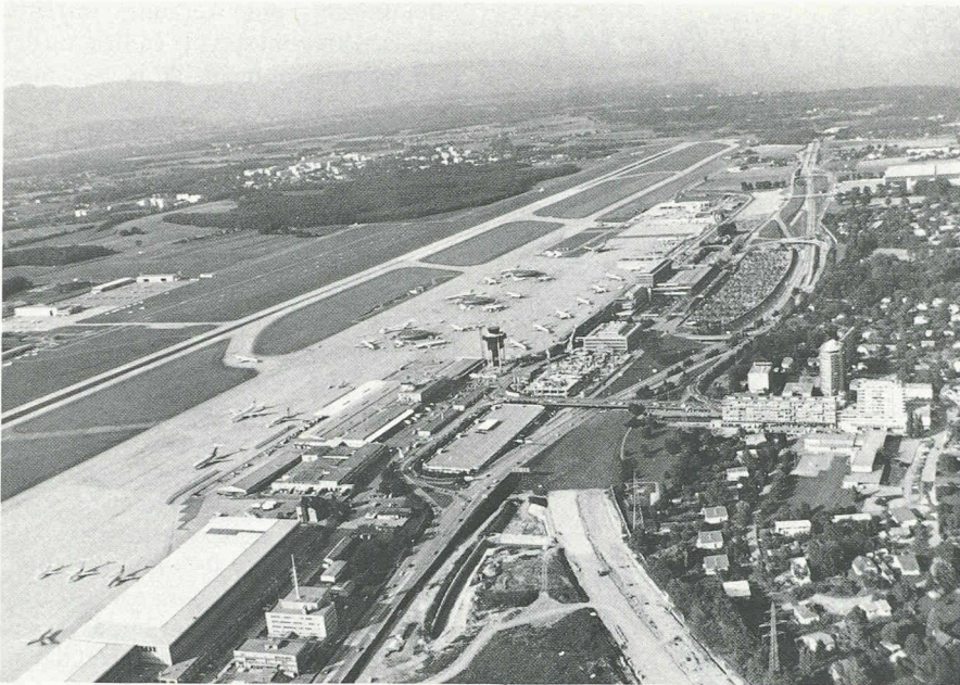
L'aéroport a véritablement ouvert Genève au monde. Aujourd'hui, il cristallise le développement : jonction autoroutière, gare CFF nouvelle, Palexpo, secteur tertiaire.