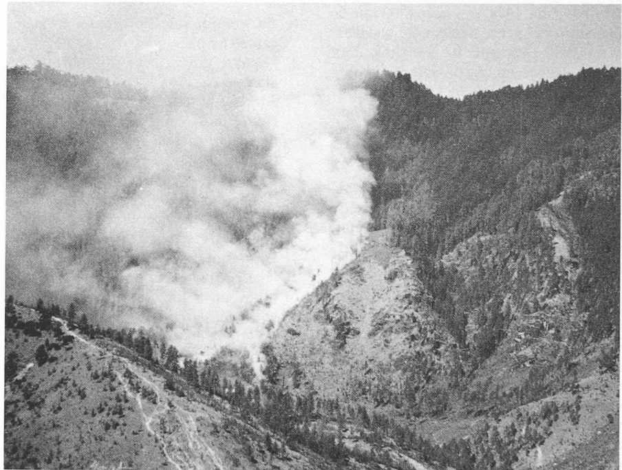
Avec la forêt, la population du monde perd aussi sa base d'existence!

Ces problèmes globaux de survie et de sauvegarde de l'environnement nous concernent tous. Leurs inextricables implications sociales, culturelles, politiques et écologiques empêchent de les maîtri-