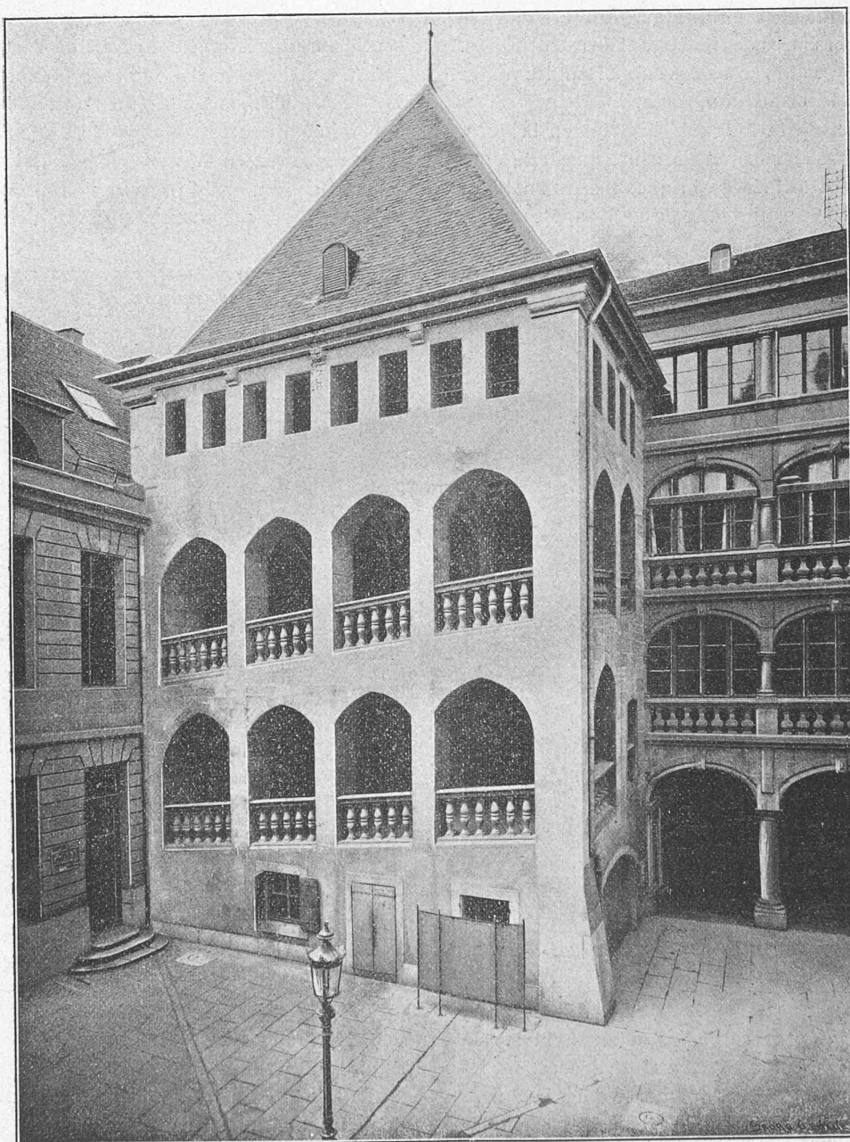
Cliché de « La Maison de Ville de Genève ». — A. Jullien, éditeur.

fonds, donne bien plus l'impression d'une tour de château-fort que d'une tour de fortification. Un simple coup d'œil jeté sur cet édifice confirme les données fournies par les documents; l'examen détaillé auquel M. Martin soumet la construction confirme cette supposition.