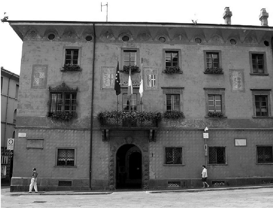
Der Palazzo Pretorio in Sondrio, ehemals Sitz des Bündner Landeshauptmanns im Veltlin. Hier erfolgten die Einvernahmen der des Komplotts verdächtigten Personen.

ohne seine Erlaubnis verlassen konnten. Sie wurden in der Tat mehrere Wochen im Palazzo festgehalten.