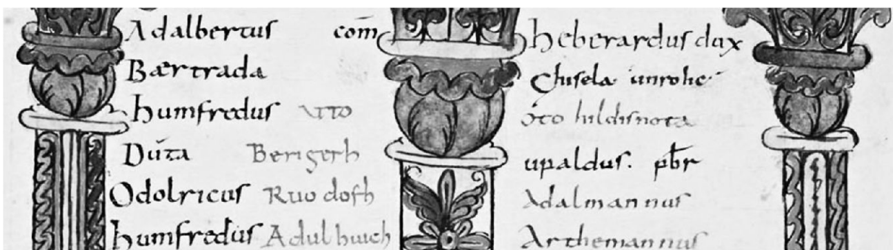
Rätische Grafenfamilie (Cod. Fab. 1, p. 66).