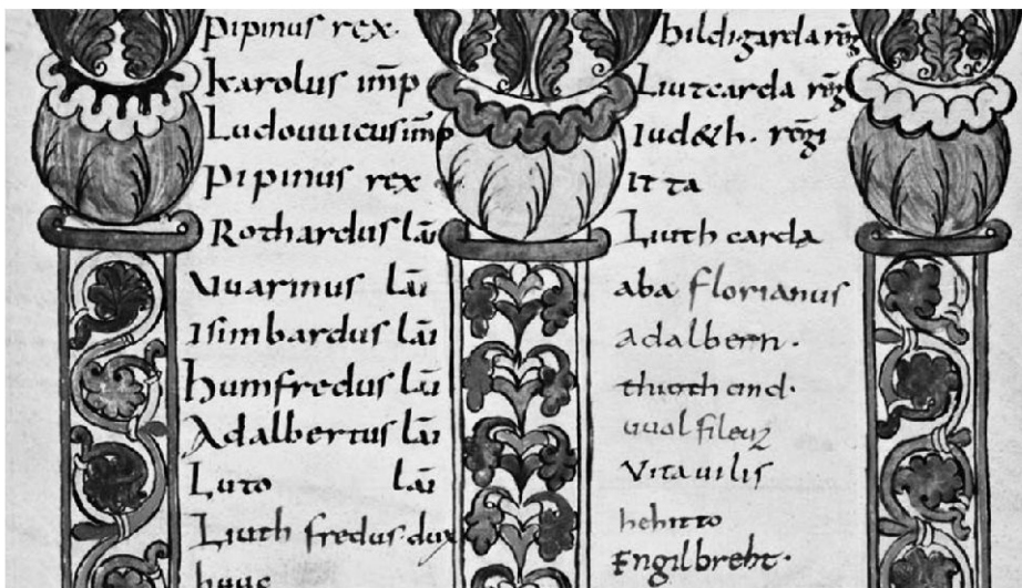
«Herrscherdiptychon» (Cod. Fab. 1, p. 24).

Dieser Eintrag nennt die Königinnen Hildegard und Lütgard, zwei der Ehefrauen Karls des Grossen, Judith, die zweite Ehe-