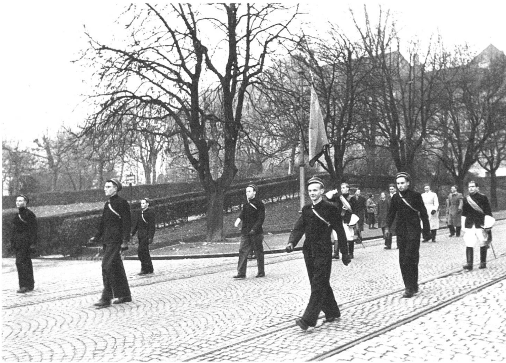
Bern, Studentenverbindung «Berna» auf dem Heimweg vom Dies academicus in der Universität, 1948.