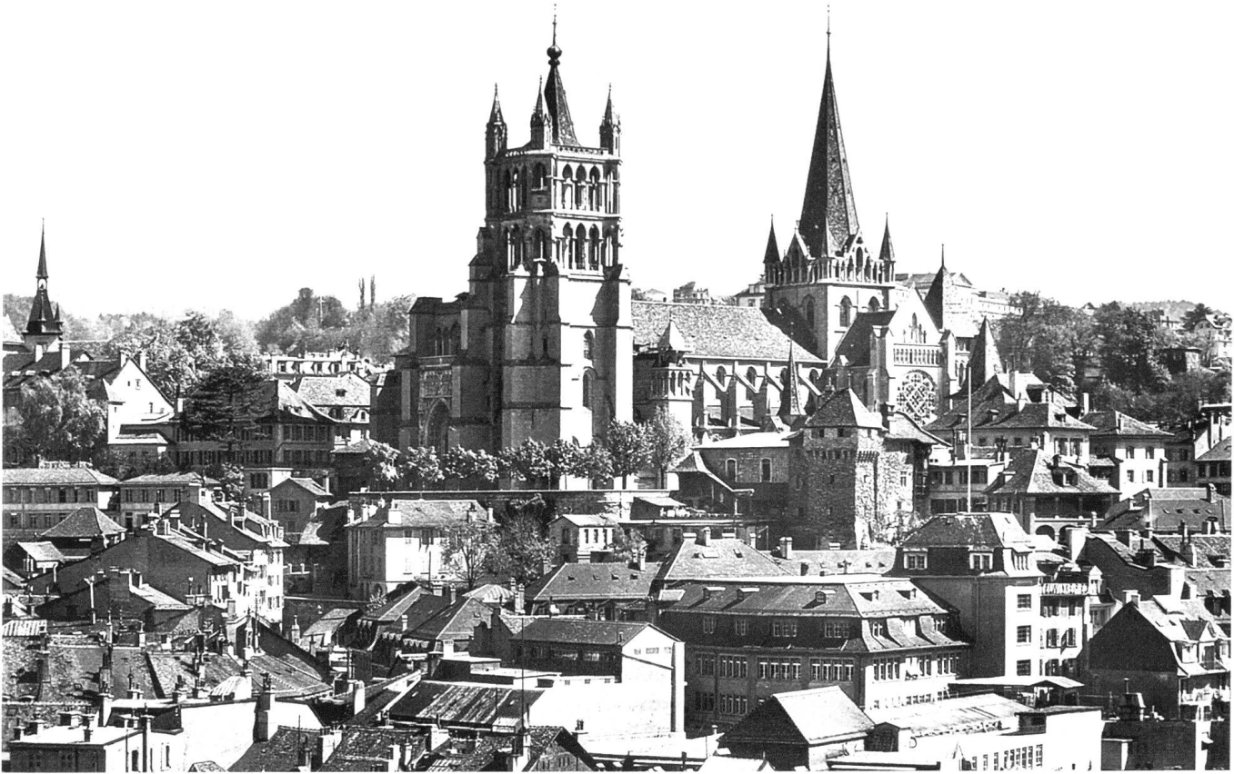
Die gotische Kathedrale von Lausanne um 1950.

weiter bis nach Morges. Ouchy ist so richtig die Sonntagsstube von Lausanne. Kinder sausen auf Tretautos oder Tretperden herum; Pärchen, Arm in Arm oder eng umschlungen, spazieren oder staunen auf die glänzende Seefläche hinaus; elegante Damen und Herren treten aus dem fünfsterneigen Hotel Beau Rivage ins Freie. Ouchy behielt sich, wenigstens damals, zum Spass die alte Tradition einer unabhängigen Gemeinde vor, «la libre commune d'Ouchy» mit «maire, flotte, gendarmerie et beaucoup de jolies filles flanquées de leur amoureux, et quelques cafés, bien entendu».