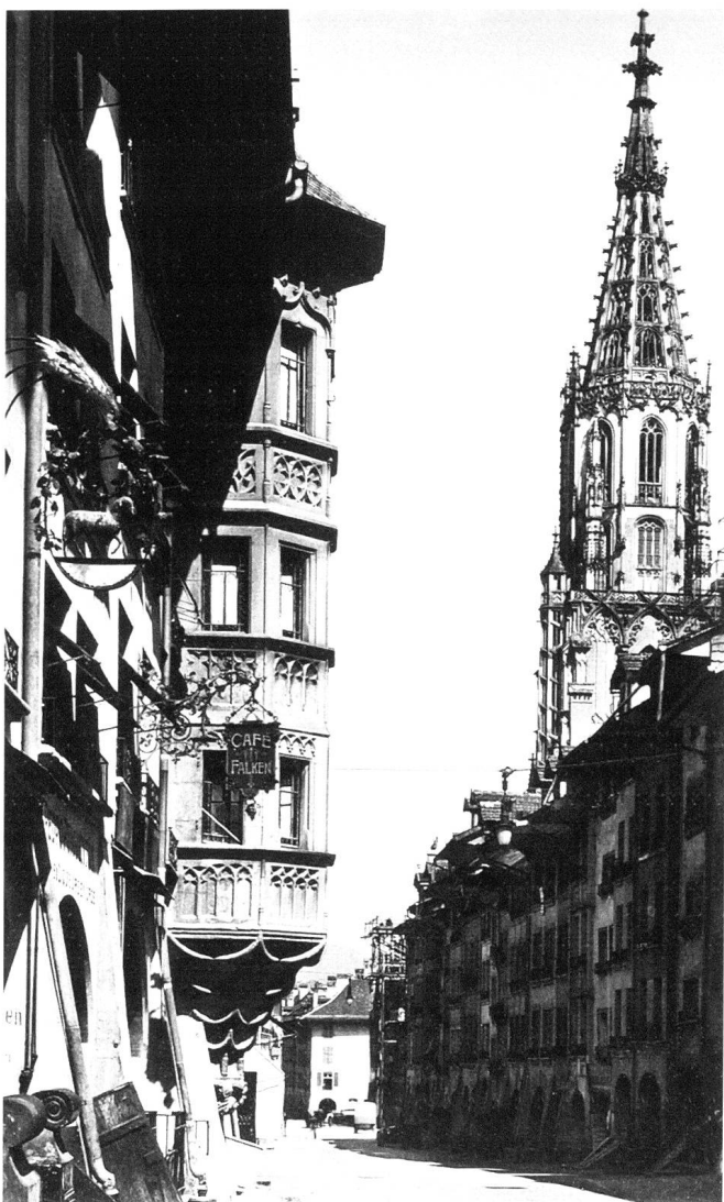
Bern, Münster um 1945.