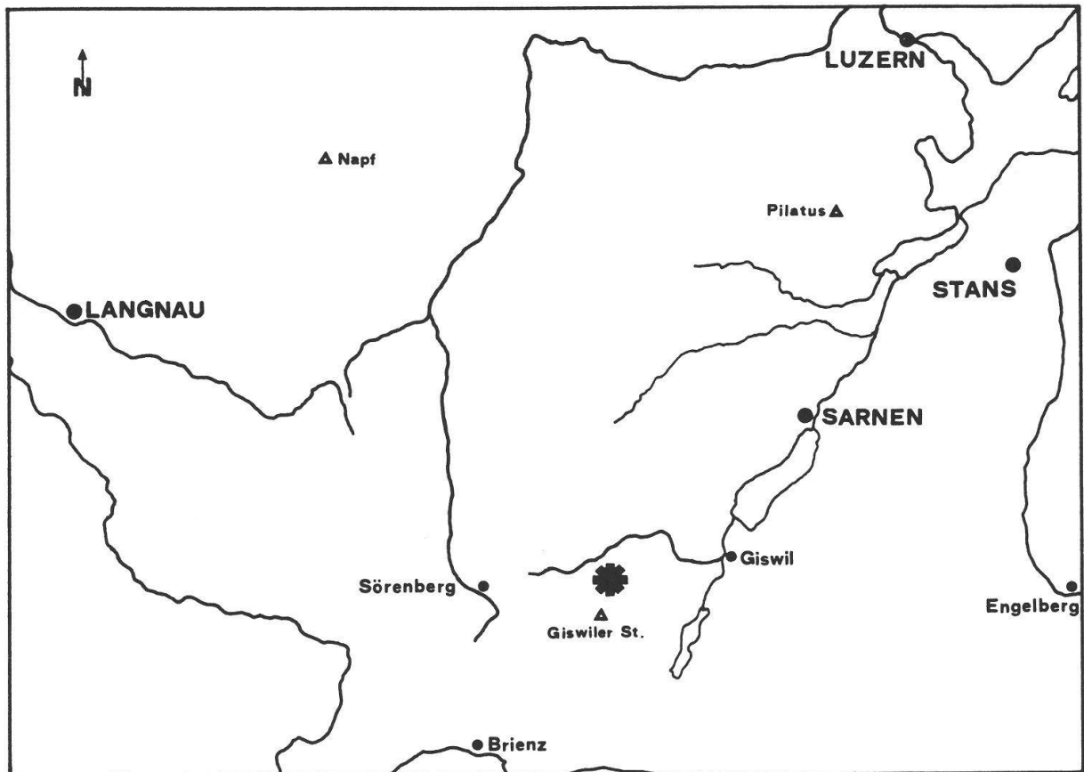
Abb. 1. Das Untersuchungsgebiet in der Zentralschweiz.