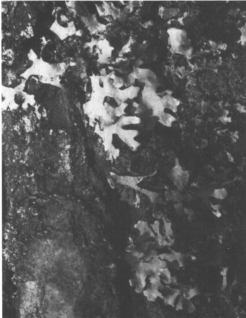
Abb. 2. Parmelia laevigata auf Tanne.

wovon die Flechten in trockeneren Perioden profitieren können. Die Buche ist im Merliwald weitaus wichtigster Träger von ozeanischen Flechten, gefolgt von der Tanne. Bergahorn und Fichte besitzen dagegen ein eher bescheidenes Spektrum ozeanischer Lichenen. Degelius (1935) gliedert die ozeanischen Flechten in euozeanische und subozeanische Arten. Bei ersteren handelt es sich um Vertreter, die sich auf das extrem ozeanische Westeuropa beschränken. Anders die subozeanischen Arten: Ihr Hauptverbreitungsgebiet liegt meist im euozeanischen Bereich. Sie sind jedoch auch in günstigen Lagen des östlicheren Nord-, Mittel- und Südeuropa anzutreffen.