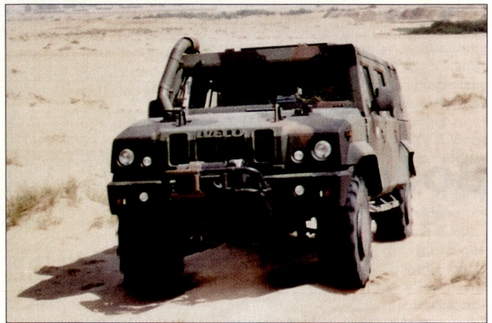
Mehrzweckfahrzeug «Caracal» mit verbessertem Schutz.

schzeitlich diverse so genannte geschützte Fahrzeuge unterschiedlicher Typen (z.B. «Dingo 2», «Duro 3», «Mungo» usw.) aus Mitteln des Sofortbedarfs beschafft worden. Gleichwohl verfügt die Bundeswehr gemäss Aussagen des Einsatzführungsstabes über ein qualitatives und quantitatives Defizit an leistungsfähigen, geländegängigen Fahrzeugen unter-