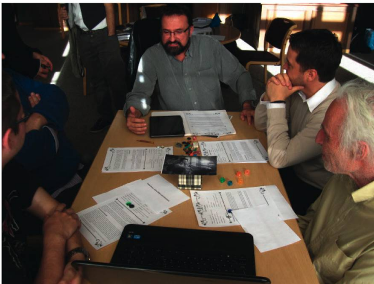
Partie de jeu de rôle à la Bibliothèque de la ville de La Chaux-de-Fonds dans le cadre d'une animation autour du jeu La Chaux-de-Fonds 1904 .

Le JdR est un loisir discret, qui s'organise entre amis dans un cadre privé. Il est donc difficile de connaître le nombre de joueurs dans notre région. D'ailleurs, aucune étude ou recensement ne peut nous donner le moindre indice à ce sujet.